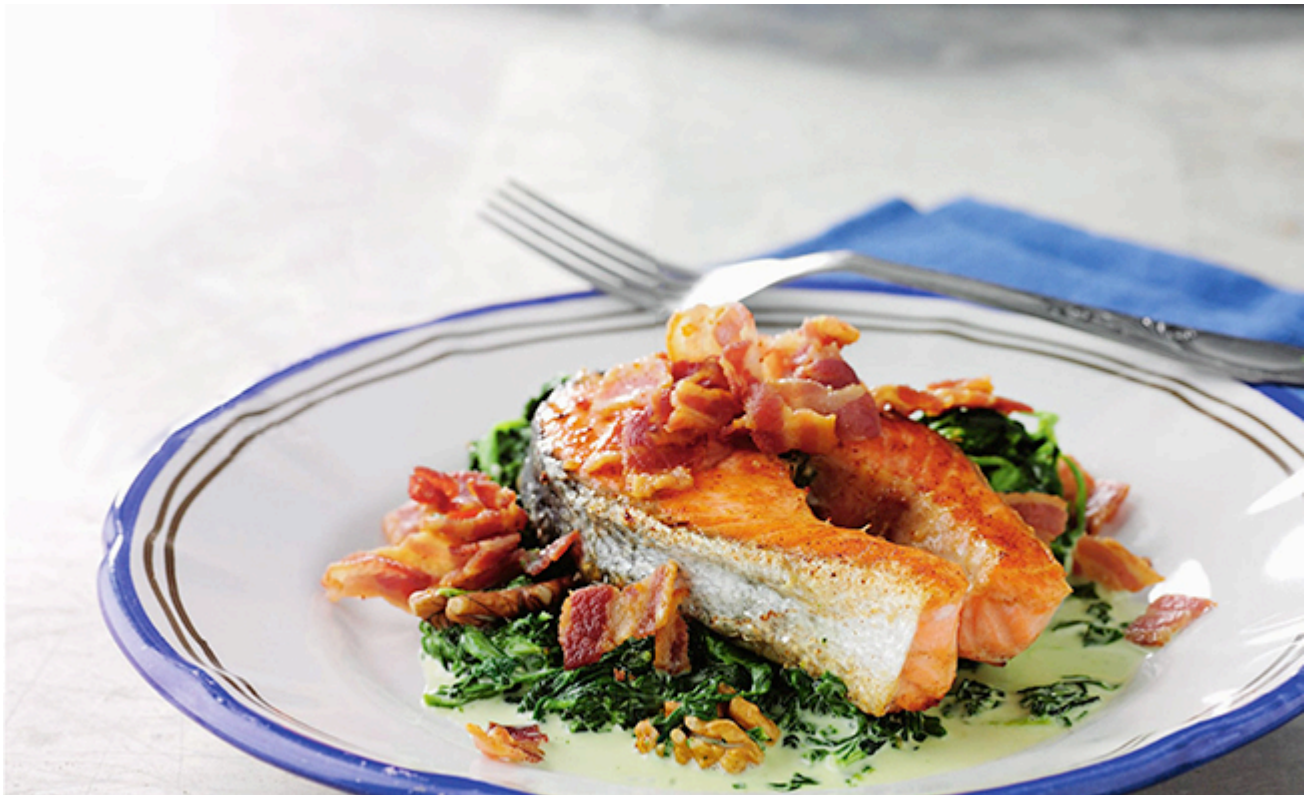
Ur denna kokbok