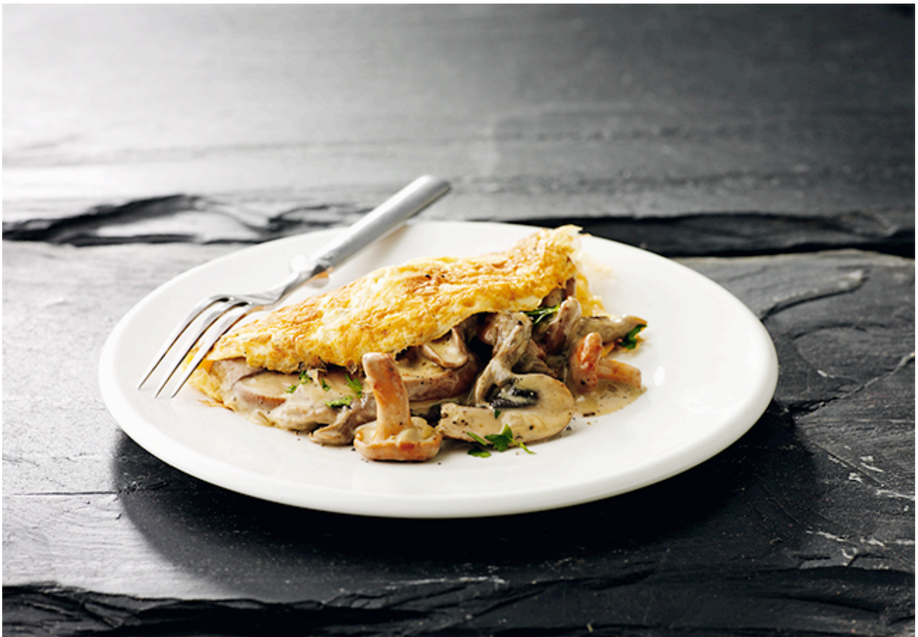
Ur denna kokbok